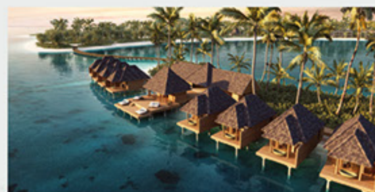
Kuda Villingili Resort, Maldív-szigetek

Folyamatos növekedésének köszönhetően mára az Interplast a görög piac első számú szállítója, ha fűtési és ivóvízhálózatok vezetékeiről van szó. Ugyanakkor növekvő exporttevékenységének köszönhetően most már a fenti ágazatok mindegyikével kapcsolatosan sokféle munkát és projektet mutathat fel Európa-szerte és a Közel-Kelet országában. Az Interplast vezető szerepet vállal számos újonnan épülő szálloda, kórház, kereskedelmi üzlet és lakóépületek gépészeti csővezetékrendszerének ellátásában.