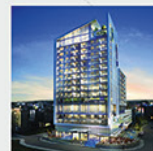
Radisson Blu Hotel, Larnaca, Ciprus