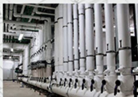
Előrszigetelt Aqua-Plus Prins gépház 5-os hotelben