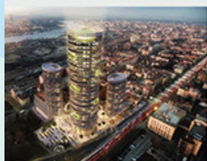
Skyline Tower, Belgrád