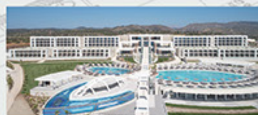
Mayia Exclusive Resort & Spa, Rodosz