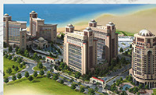
A Szent Regis Doha, Katar