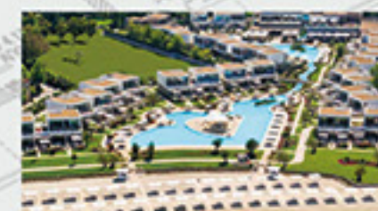
Sani Dunes, Chalkidiki