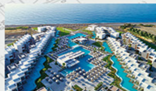
Atlantica Dreams Resort & Spa, Rodosz