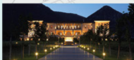
Domaine Biblia Chora, Kavala