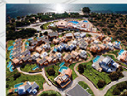
Domes of Elounda, Kréta