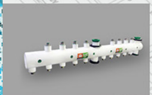
Szigetelt Aqua-Plus Prins osztó-gyűjtő 5-os hotelben