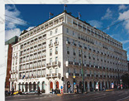
Grande Bretagne, Athén