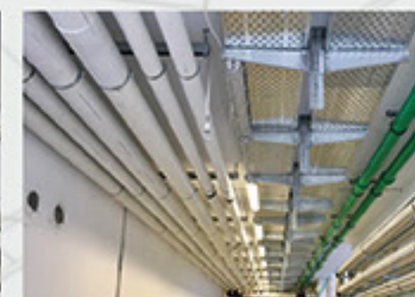
Aquaplus és Aqua-Plus Prins csövek 5-os hotelben