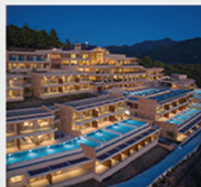
MarBella Elix 5*, Καραβοστάσι