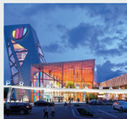
Pristina Mall, Πρίστινα