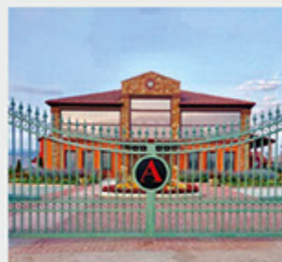
Κτήμα Άλφα, Αμύνταιο