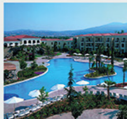
Hyatt Regency 5*, Θεσσαλονίκη