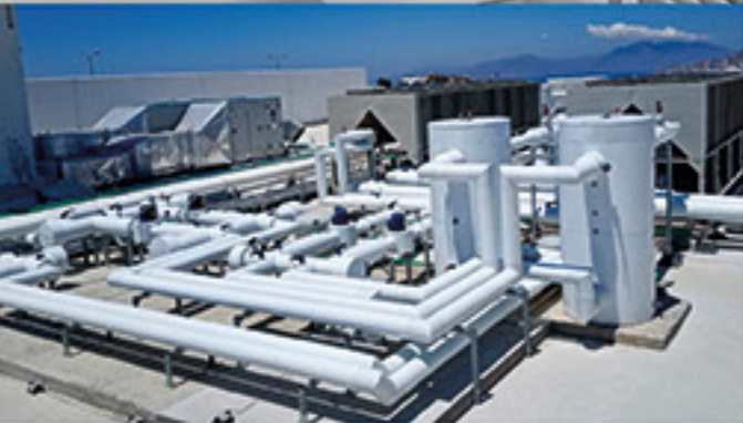
Atlantica Aegean Blue 5*, Ρόδος

ΠΙΣΤΟΠΟΙΗΜΕΝΟ ΣΥΣΤΗΜΑ ΑΠΟ ΤΟ ICC ΑΜΕΡΙΚΗΣ