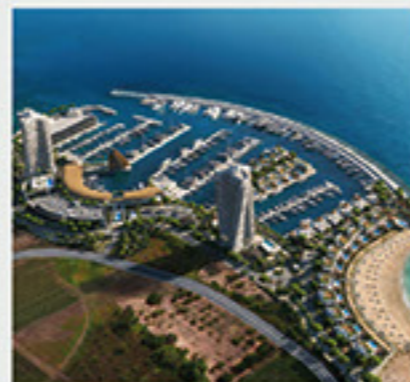
Agia Napa Marina, Κύπρος