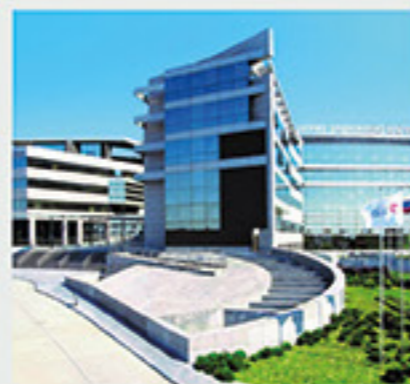
Ιατρικό Διαβαλκανικό Κέντρο, Θεσ/νίκη