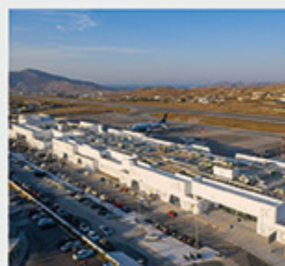
Αεροδρόμιο Μυκόνου (JMK), Μύκονος