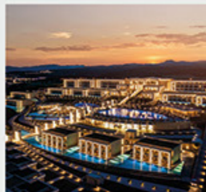
Mayia Exclusive Resort & Spa 5*, Ρόδος

Η συνεχής ανάπτυξη, η καινοτομία και η ποιότητα των προϊόντων της Interplast την έχουν κατατάξει στην πρώτη θέση στην Ελλάδα σε ό,τι αφορά τα δίκτυα πλαστικών σωληνώσεων στην ύδρευση, τη θέρμανση και τον κλιματισμό. Ταυτόχρονα, η εξωστρέφεια και η εξαγωγική δραστηριότητα σε 60 χώρες έχουν ως αποτέλεσμα την τοποθέτηση των προϊόντων της εταιρίας σε πολύ σημαντικά έργα σε Ευρώπη, Αμερική, Αφρική και Μέση Ανατολή. Παρακάτω παρουσιάζονται επιγραμματικά κάποια από τα σημαντικότερα έργα, στα οποία έχει εγκατασταθεί το σύστημα των προμονωμένων σωλήνων και εξαρτημάτων Aqua-Plus Prins της Interplast.