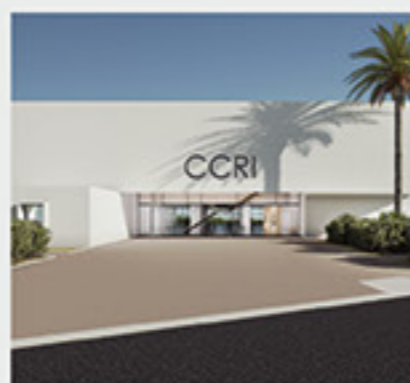
Ινστιτούτο Έρευνας Καρκίνου, Κύπρος