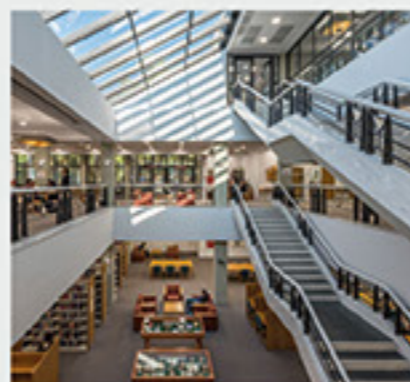
Κολέγιο Deree, Αγ. Παρασκευή, Αθήνα