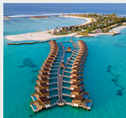
Kuda Villigili Resort 5*, Μαλδίβες