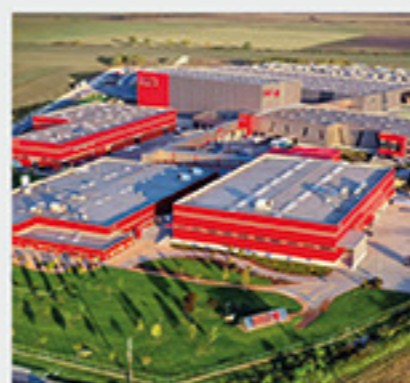
Βιομηχανία Hell Energy Drinks, Ουγγαρία